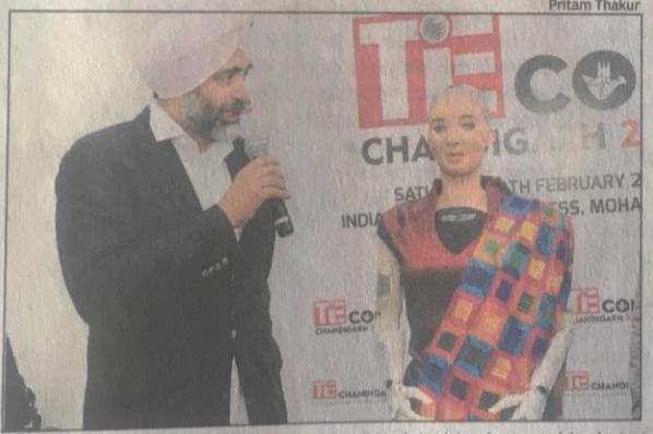
Punjab finance minister Manpreet Singh Badal with a humanoid robot at 'TiECon Chandigarh 2020' in Mohali on Saturday

The FM also announced rembursement of registration